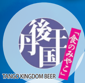
TANGO KINGDOM BEER