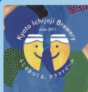
京都・一乗寺ブリュワリー