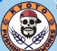
Kyoto Fushimi Beer Works