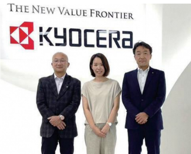
活動には若手社員、女性社員も携わっている

●京セラ株式会社本社 | 〒612-8501 京都市伏見区竹田鳥羽殿町6 | ☎ 075・604・3514 | URL : https://www.kyocera.co.jp/