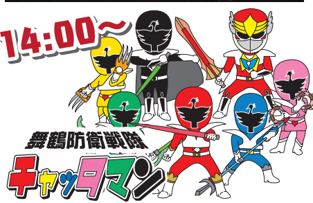
舞鶴防衛戦隊 キックダンス