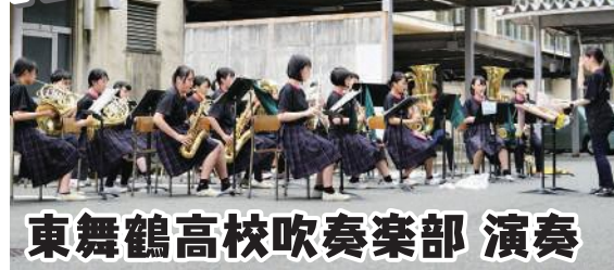
東舞鶴高校吹奏楽部 演奏