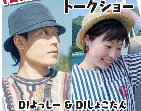
DIよっしー & DIしよこたん