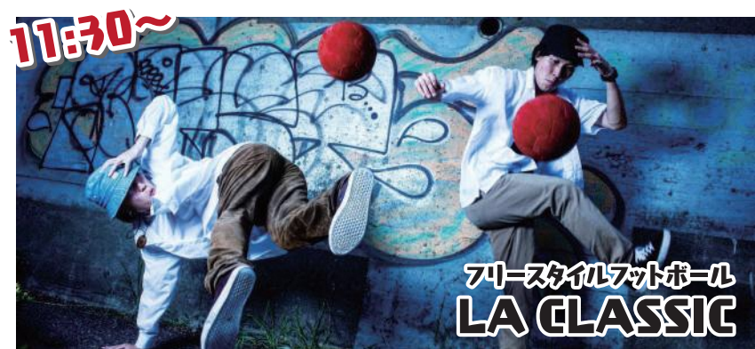
フリースタイルフットボール LA CLASSIC

LA CLASSIC (ラ・クラシック) フリースタイルフットボール世界一のコンビ。7年連続表彰台入り。京都府スポーツ特別奨励賞と舞鶴市優秀スポーツ賞特別賞を受賞。名作を創るをコンセプトに活動している。