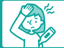
体調の悪い方の来街の自粛