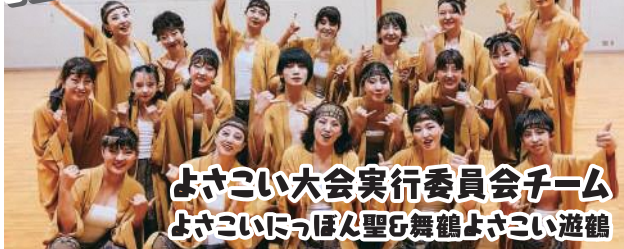
よさこい大会実行委員会チーム よさこいっほん聖&舞鶴よさこい遊鶴