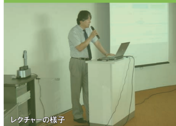
レクチャーの様子

※ 事務局が準備したプロジェクト素材の説明を受け、また各自が準備したプロジェクトの企画・提案を行ったうえで、空き店舗の活用や商店街活性化等、専門家によるアドバイスを受けることができます。