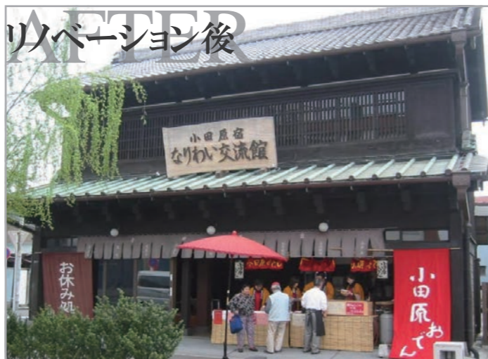
リノベーション後 小田原宿なりわい交流館