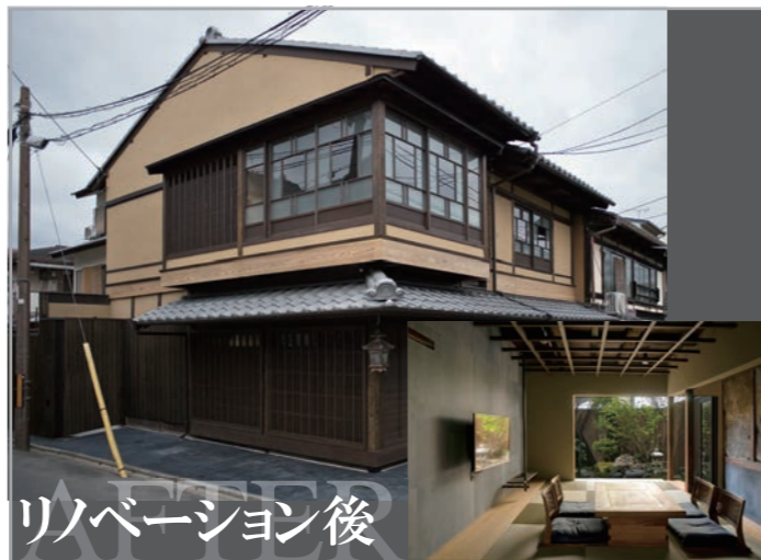
リノベーション後 旅庵 然 (旅館)