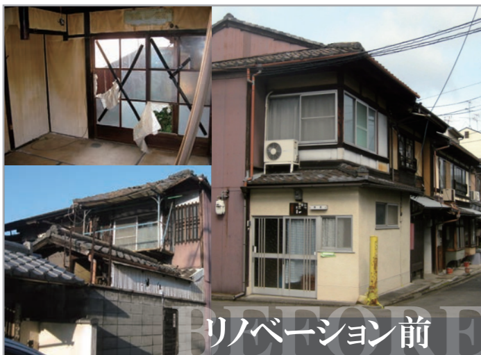
リノベーション前 京都の町家