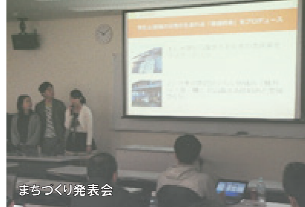
まちづくり発表会