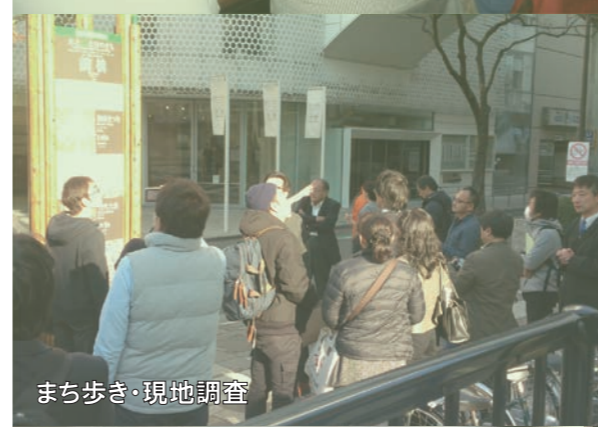
まち歩き・現地調査

※ 参加者はプロジェクトの発表を行い、講師の先生方から広くアドバイスを受けることができます。