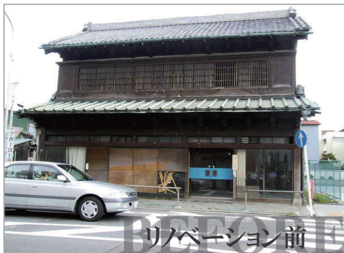
リノベーション前 旧魚網問屋(築83年)